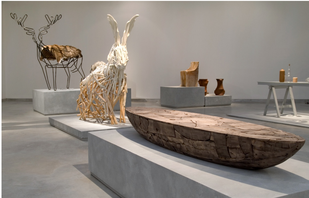
Figura 4: Muestra “Post-fosil”. Muestra de mas de 60 diseñadores emergentes curada por Lidewij Edelkoort / DMH

El caso de los museos de diseño es interesante porque que une, de alguna forma, una preocupación etnográfica con una estética en un mismo ámbito, haciendo un señalamiento particular y problematizando las diferencias o similitudes entre artefacto y obra. Pareciera que en el DMH propone a través de su retorica “leer” a los artefactos, al museo y a las exposiciones en clave de arte contemporáneo y por lo tanto en forma estética, autónoma y metafórica independiente de la cultura o contexto histórico a la que pertenece; y al mismo tiempo como artefactos étnicos representantes de las culturas de las que provienen (sinécdoque) (BAL, 1996). Quizás la idea del “diseño” como lenguaje y origen metodológico común de la gestación de todos estos artefactos es lo que permite que esta conjunción que pareciera antagónica funcione tan naturalmente y pueda ser finalmente un recurso para el objetivo de Israel de posicionarse como un actor de peso en el campo del diseño internacional.