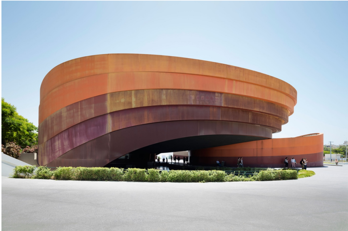
Figura 1.: Vista lateral del edificio del DMH

El objetivo principal del DMH es inspirar y desafiar la percepción que la comunidad del diseño y el público en general tienen sobre el diseño y la forma en que afecta sus vidas. El DMH es la manifestación de la importancia que la ciudad de Holon le otorga a la cultura y a la educación, y del deseo de posicionar al diseño como una actividad líder de la agenda cultural israelí. (DESIGN MUSEUM HOLON, 2019)