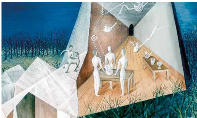
Remedios Varo, Paisaje, torre, centauro, 1943.